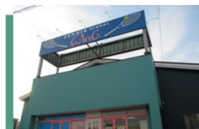
ウイング札幌羊ヶ丘校