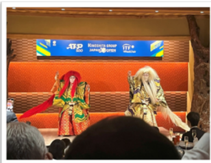
【レセプションでの歌舞伎】