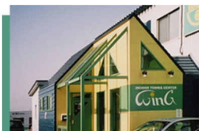
ウイング札幌大谷地校