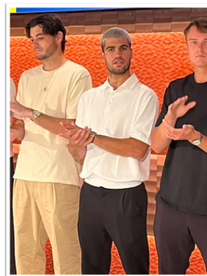
【アルカラス選手：世界No1は凄かった！】