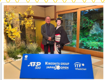
【レセプション会場でのお出迎え】

今年のジャパンオープンテニスも、ロイヤルボックスで観戦する事が出来ました。 更に大会初日に行われたレセプションにも呼ばれ、感動的な大会となりました。